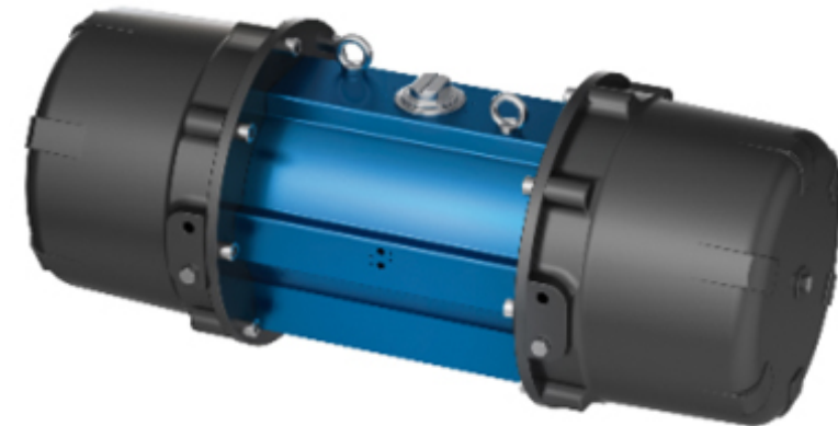
SADT / SADF